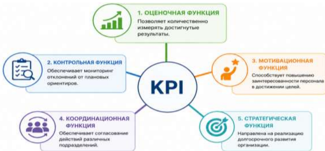
Рис.1. Функции KPI в системе управления эффективностью организации

В рамках данного подхода KPI рассматриваются как ключевые индикаторы, отражающие уровень выполнения стратегических задач предприятия, результативность бизнес-процессов, эффективность использования ресурсов и качество управленческих решений. Методологически система KPI ориентирована на принципы конкретности, измеримости, достижимости, релевантности и ограниченности во времени (SMART-подход), что обеспечивает ее практическую применимость в различных сферах управления.