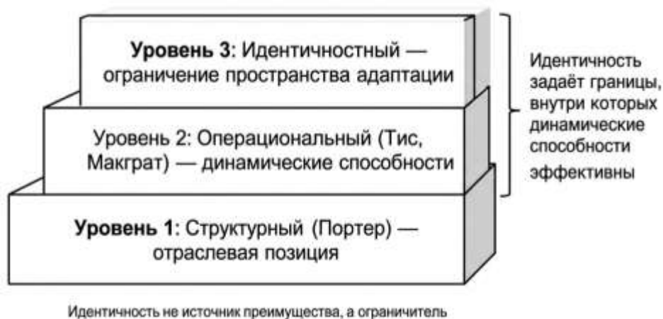
Рисунок 1 изображает эту трёхуровневую конструкцию: нижний уровень – структурный (отраслевая позиция по Портеру), средний – операциональный (динамические способности), верхний – идентичностный (ограничение пространства адаптации). Стрелка от верхнего уровня к среднему показывает, что

идентичность задаёт границы допустимой адаптации.