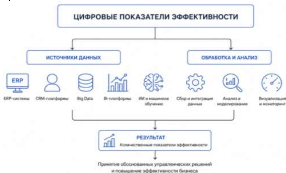
Рис.2. Цифровые показатели эффективности процесса

С методологической позиции цифровые показатели эффективности основываются на принципах data-driven management, предполагающего использование объективной аналитической информации как основы для принятия управленческих решений. Это позволяет организациям перейти от ретроспективного анализа результатов к предиктивному управлению, где оценка эффективности включает не только фиксацию текущих показателей, но и прогнозирование рисков, сценарное моделирование и оптимизацию бизнес-процессов.