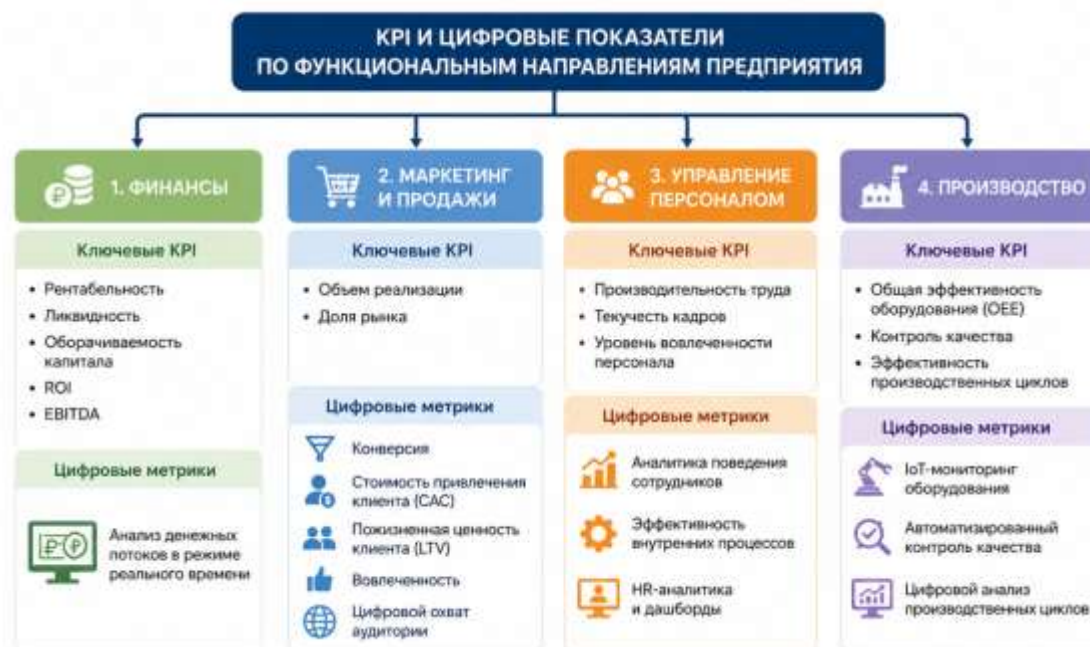
Рис.3. Применение КРІ и цифровых показателей по функциональным направлениям деятельности предприятия

Применение КРІ и цифровых показателей охватывает все ключевые функциональные направления деятельности организации (рис.3.).